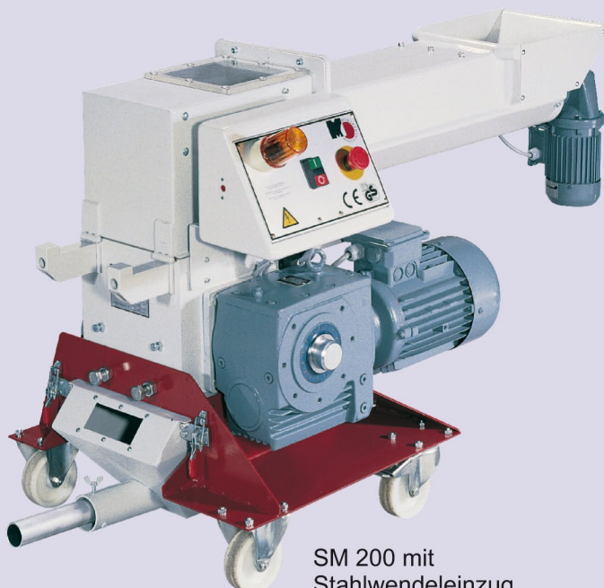
SM 200 mit Stahlwendeleinzug