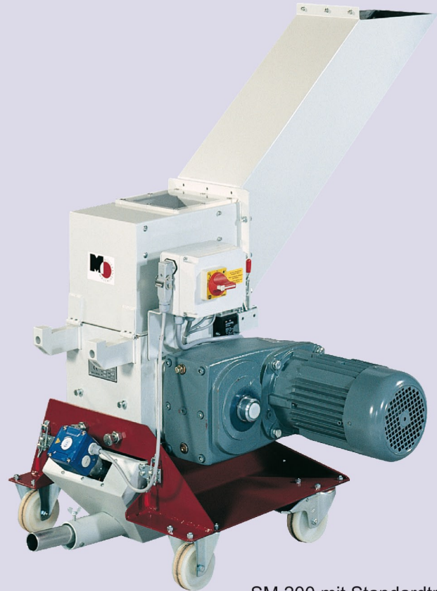
SM 200 mit Standardtrichter

Ob als Beistellmühle für Angüsse, zum zerkleinern von Ausschußteilen oder als kleine Zentralsmühle. Die Maschinen sind überall universell einsetzbar.