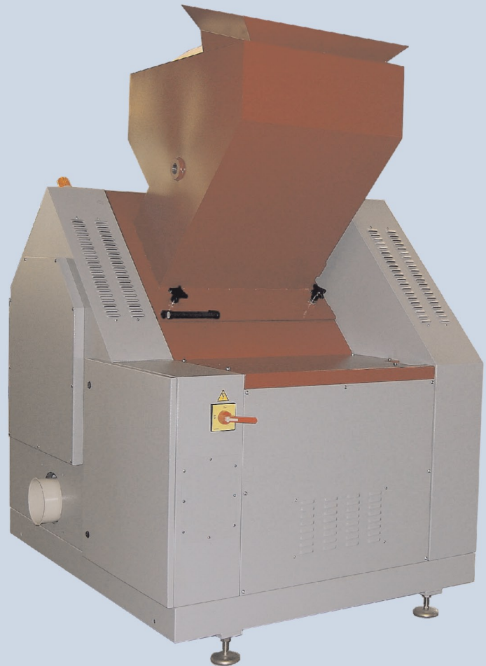
SM 1200 Rückseite