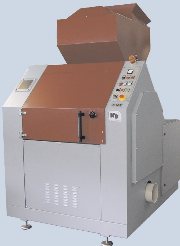
SM 1200 Vorderseite

Wie alle Müller Schneidmühlen ist auch die Schneidmühle SM 1200 in unserem Werk in Frankfurt/M konstruiert, hergestellt und montiert.