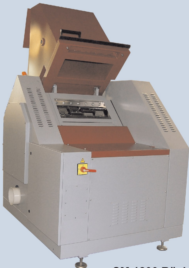
SM 1200 Rückseite mit geöffnetem Trichter